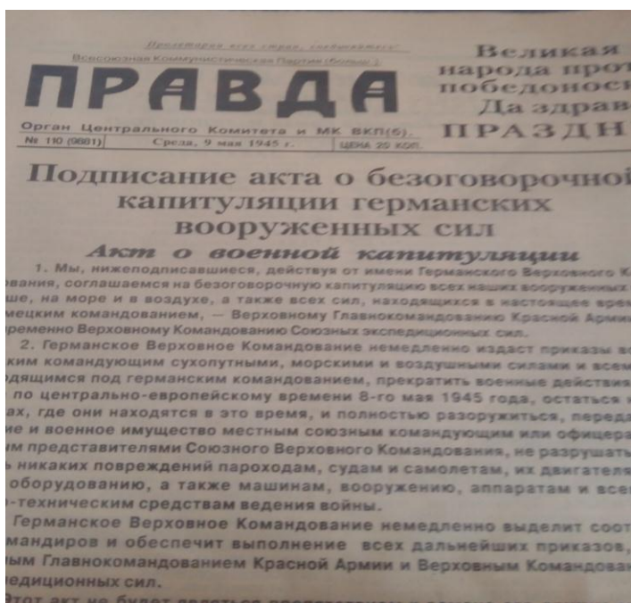
Газета «Правда» от 9 мая 1945 года