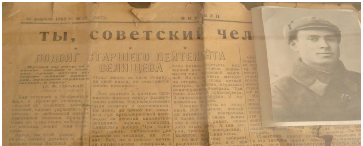
Газета «Кировец» от 23 февраля 1962 года рассказывает о нашем герое — земляке