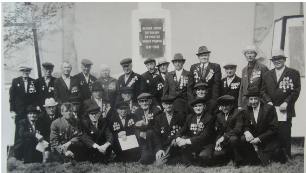
Ветераны сельского поселения Колывань 9 мая 1987 года