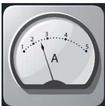
Рис. 12. Датчик тока

Датчик тока (рис. 12) измеряет значения постоянного и переменного электрического тока. В комплекте датчика находятся провода разного цвета с зажимами типа «крокодил» для подключения к электрическим схемам и штекерам для соединения с беспроводным мультиметром.