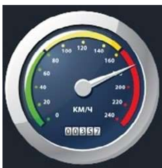
Рис. 15. Датчик ускорения