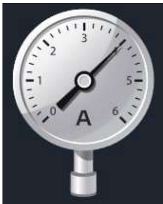
Рис. 16. Датчик абсолютного давления

Датчик абсолютного давления (рис. 16) производит измерения абсолютного давления. Чувствительный элемент датчика выполнен на базе монокристаллического кремниевого пьезорезистора с внедрённой тензорезистивной структурой, которая позволяет исключить возможные погрешности и достигнуть необходимой точности измерений. В комплект входит гибкая герметичная трубка для подключения штуцера датчика к лабораторному оборудованию.