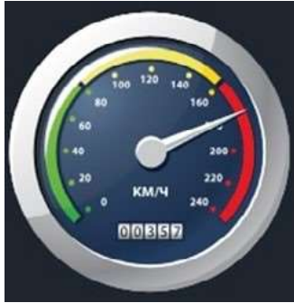
Рис. 15. Датчик ускорения

Датчик ускорения (рис. 15) производит измерения ускорения движущихся объектов по трём осям координат.