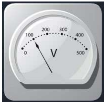
Рис. 11. Датчик напряжения

Датчик напряжения (рис. 11) измеряет значения постоянного и переменного напряжения. В комплекте датчика находятся провода разного цвета с зажимами типа «крокодил» для подключения к электрическим схемам и штекерам для соединения с беспроводным мультидатчиком. Диапазон измерения выбирается в программном обеспечении сбора и обработки данных.