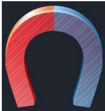
Рис. 13. Датчик магнитного поля

Датчик магнитного поля (рис. 13) измеряет значение индукции магнитного поля. Он выполнен в виде выносного зонда. Чувствительный модуль датчика построен на интегральном элементе Холла и смонтирован в торцевой части зонда.